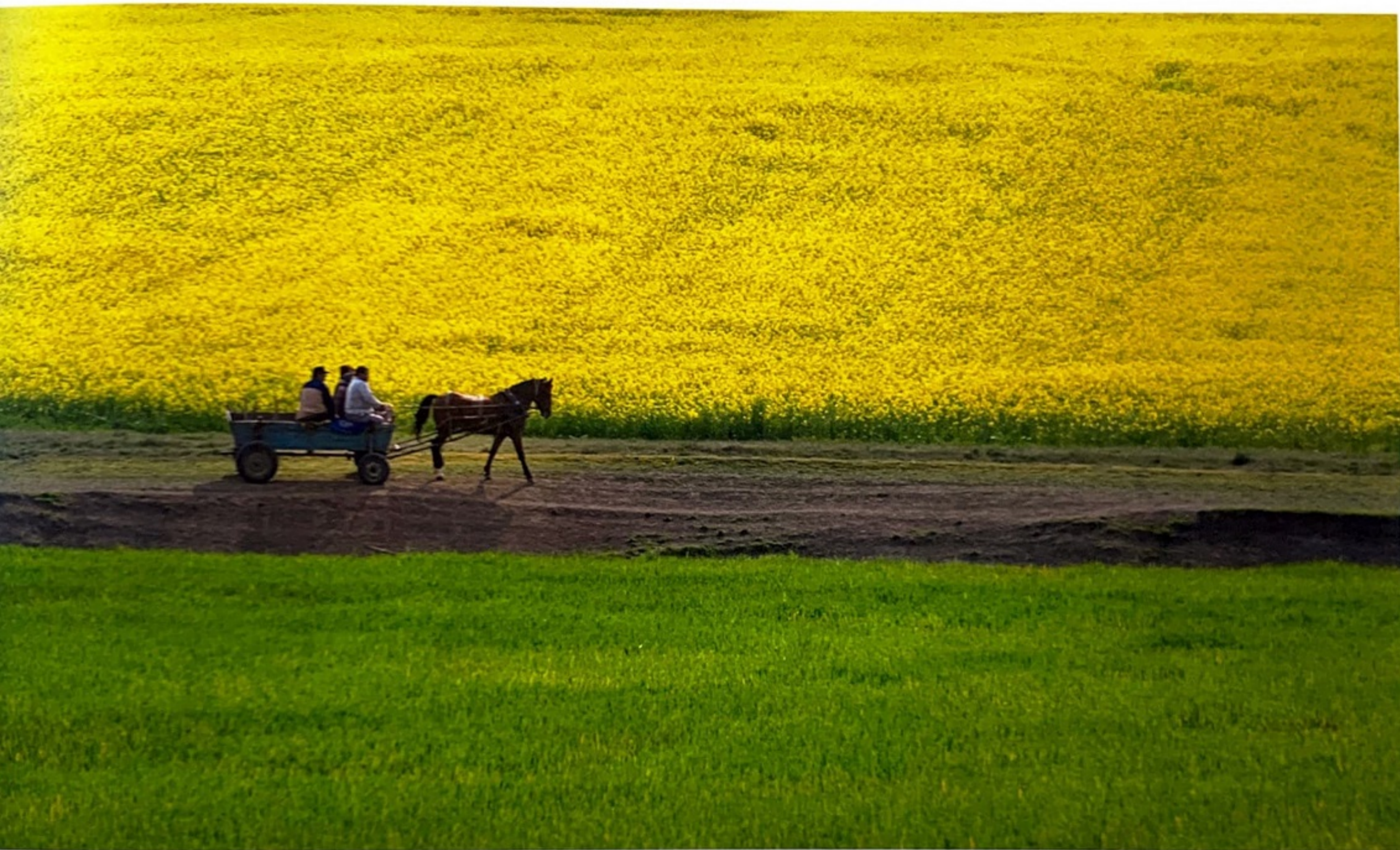
Per le strade di campagna, nella Dobrugea